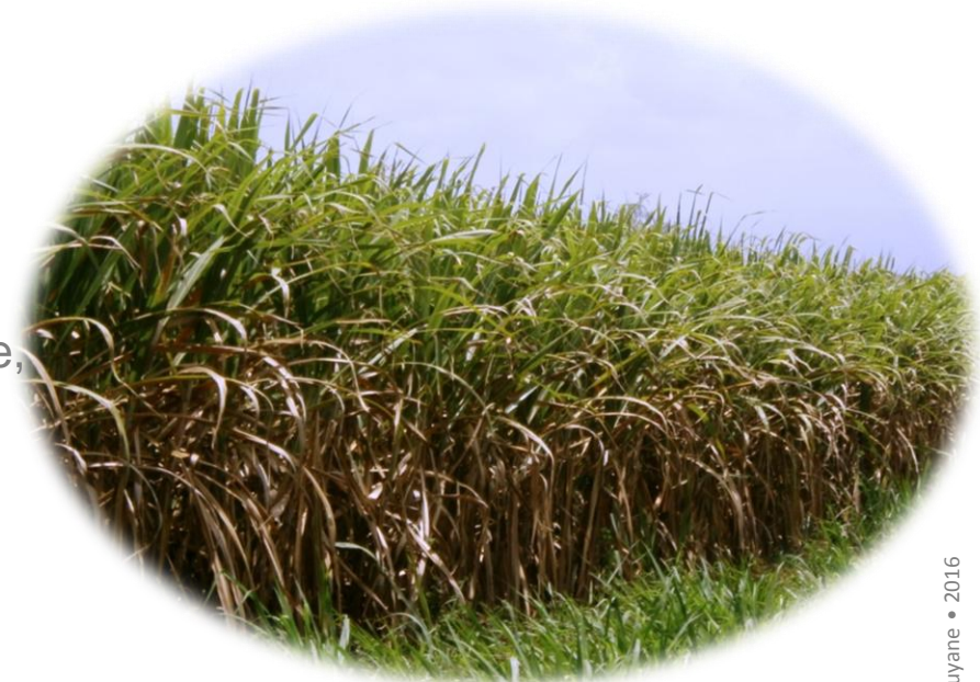
Champ de canne à sucre. Sainte-Rose, Guadeloupe.