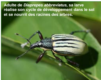
Adulte de Diaprepes abbreviatus , sa larve réalise son cycle de développement dans le sol et se nourrit des racines des arbres.