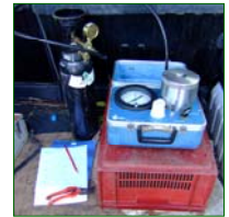
Ci-dessus : outil de mesure du potentiel hydrique par chambre à pression Scholander. Ci-dessous : influence d'une plante de couverture sur les populations d'acariens phytophages en verger d'agrumes. La plante de couverture par rapport à un sol nu (pratique de l'agriculteur) semble être un refuge des prédateurs naturels ( Phytoseiidae ) de ce ravageur car les phytoséides sont moins fréquents sur les mandariniers associés.