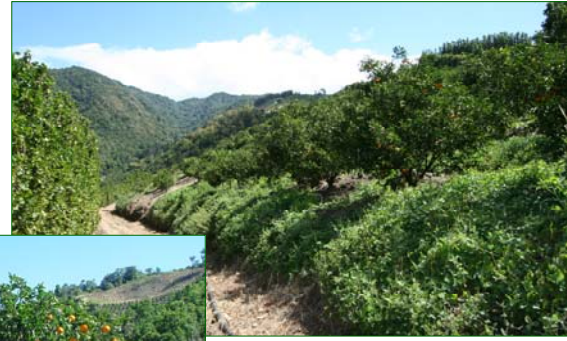
Ci-dessus : implantation d'une plante de couverture ( Macroptilium atropurpureum ) en verger à forte pente. Ci-contre : gestion de l'enherbement par des herbicides, les risques d'érosion sont importants.

Différentes enquêtes de terrain ont permis d'identifier et de hiérarchiser les principales sources de pollution inhérentes à l'agrumiculture guadeloupéenne. Deux d'entre-elles sont liées à la lutte contre des ravageurs : i) insecticides aux sols en jeunes vergers contre la larve de Diaprepes spp. ii) acaricides préventifs contre les acariens phytophages (ravageur de qualité des fruits). L'autre source de pollution est la conséquence d'une pratique culturale, à savoir iii) la gestion par des herbicides réguliers (4 à 6 par an) de l'enherbement du verger.